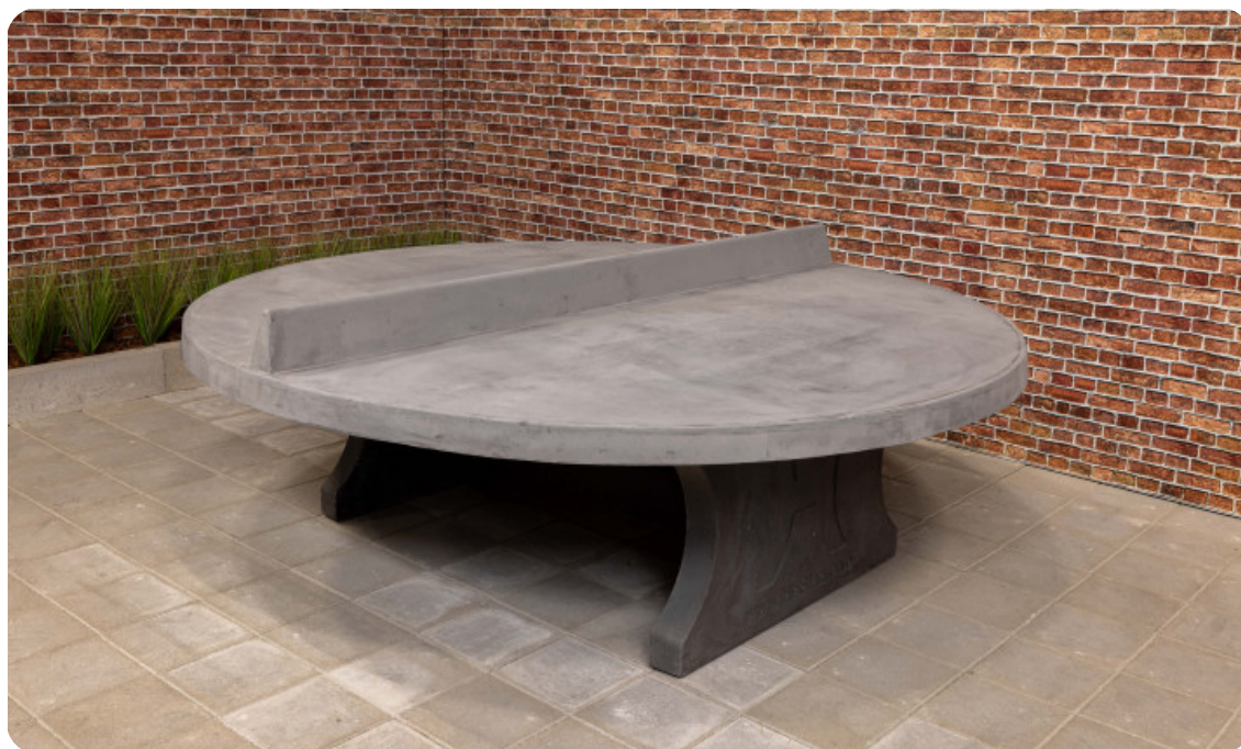
Table de ping-pong béton-anthracite ronde