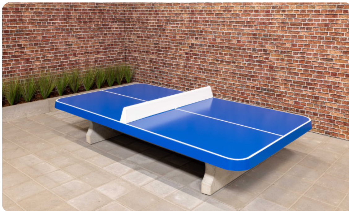
Table de ping pong basse bleu, angles arrondis